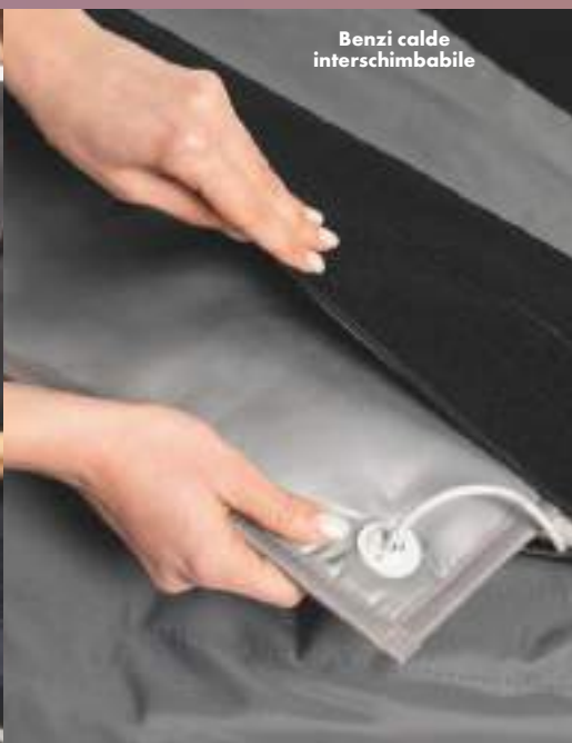
Benzi calde interschimbabile