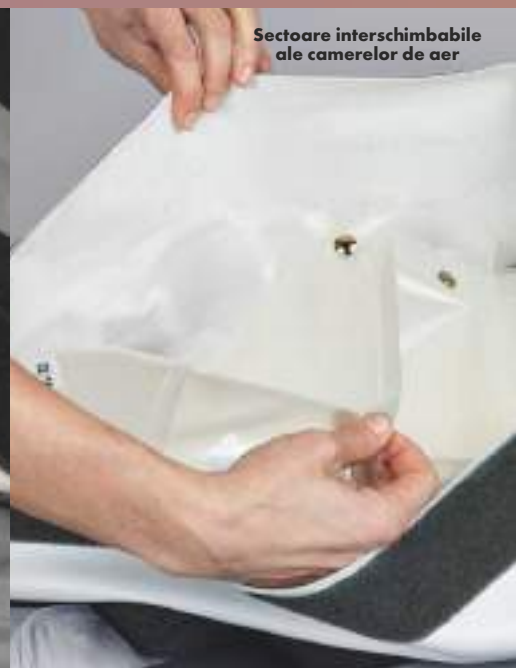
Sectoare interschimbabile ale camerelor de aer