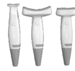
1x Aplicator - facial 3 capete interschimbabile