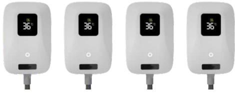
4x Aplicatori mari - corporal

11 capete de tratament cu dimensiuni diferite, ce permit tratarea mai multor zone.